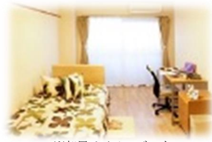
※部屋はイメージです